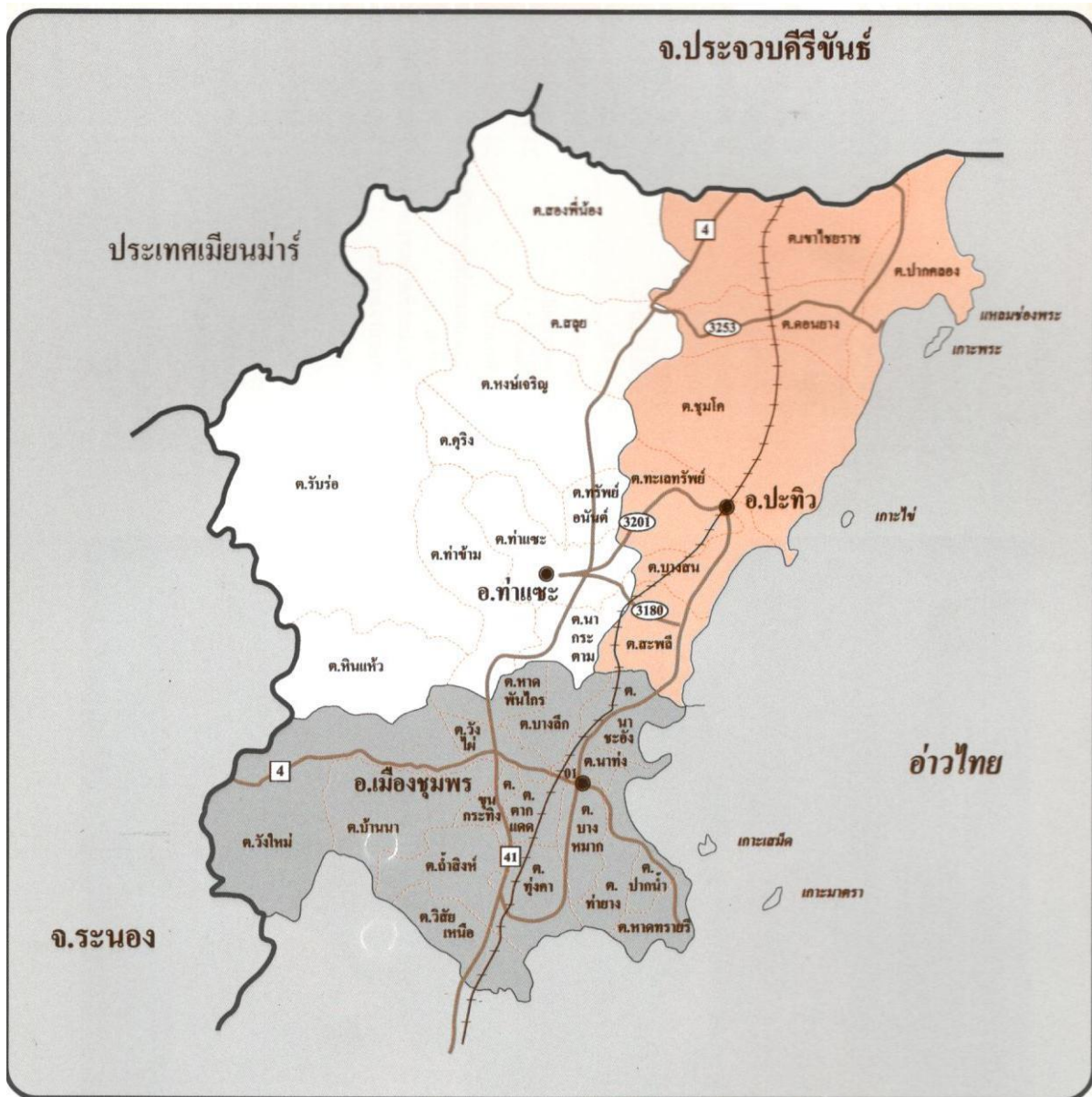
แผนที่แสดงเขตบริการของสำนักงานเขตพื้นที่การศึกษาประถมศึกษาชุมพร เขต 1

สำนักงานเขตพื้นที่การศึกษาประถมศึกษาชุมพร เขต 1 ตั้งอยู่เลขที่ 60/1 หมู่ที่ 5 ตำบลขุนกระโทง อำเภอเมือง จังหวัดชุมพร โทรศัพท์ 0-7757-6458 โทรสาร 0-7757-6253 มีอาณาเขตและเขตบริการในความรับผิดชอบจัดการศึกษา 3 อำเภอ ประกอบด้วยอำเภอเมืองชุมพร อำเภอท่าแซะ และอำเภอปะทิว